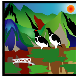
雷鳥イメージ カラーコード

12:30 会場、受付 13:00~13:10 開会挨拶 松原吉隆 とやまITベンチャー協議会/未来観光戦略会議 会長