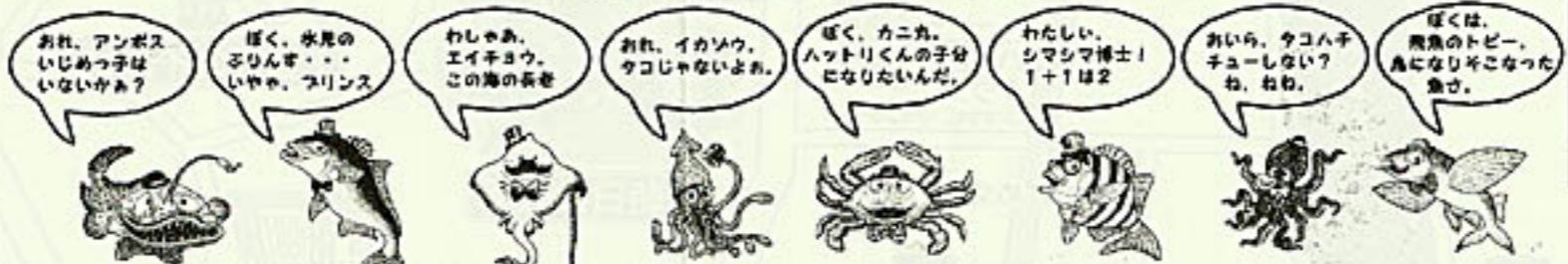
①アンボス ②プリンス ③エイチョウ ④イカゾウ ⑤カニ丸 ⑥シマシマハカセ ⑦タコ八 ⑧トビー